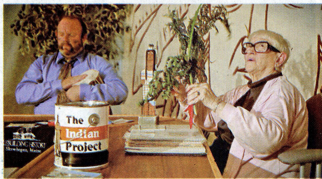
The Indian Project, (2015). Video monocal.