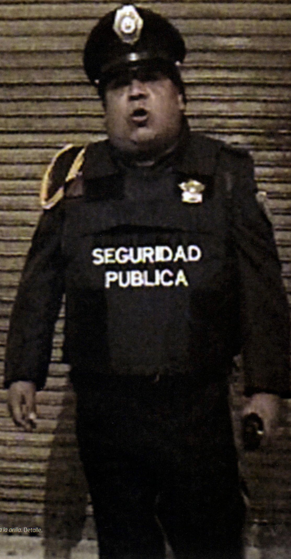
Orillise a la orilla. Detalle.