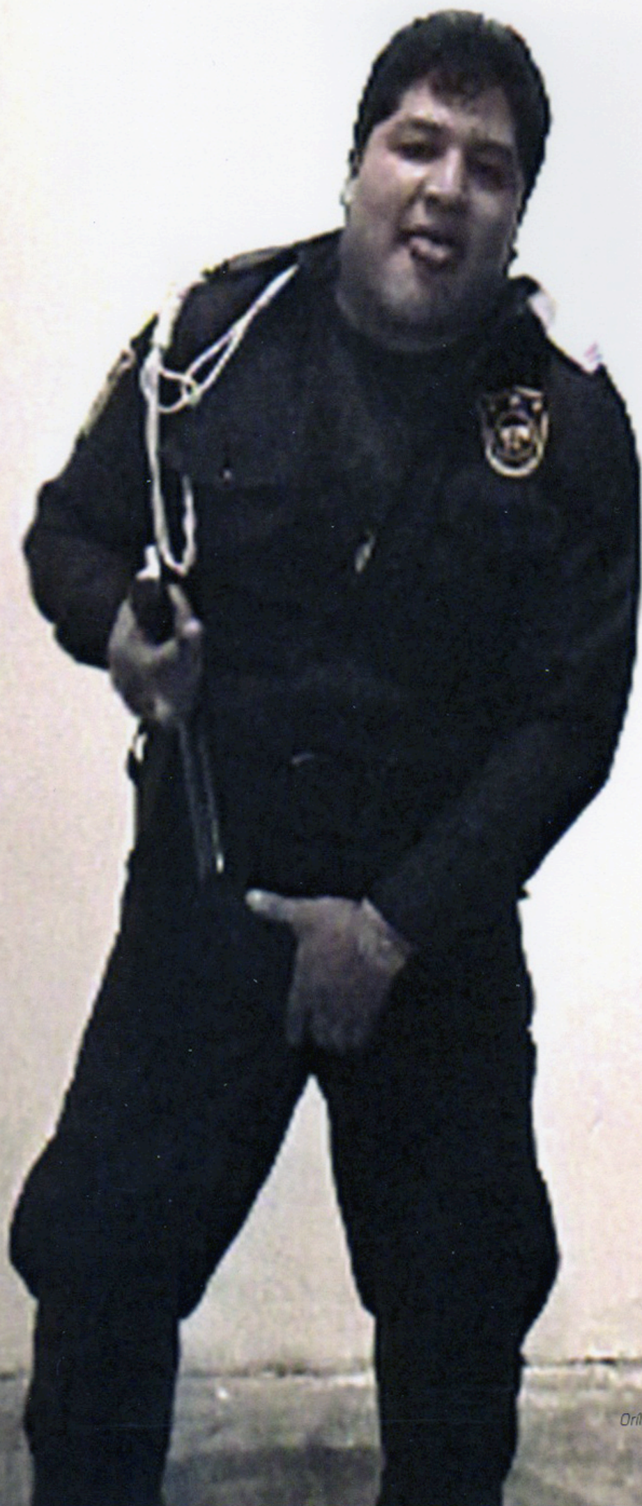
Orllise a la orilla. Detalle.